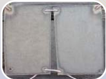
จิงใจเหล็ก® ทนโคโรสเตรสเสีย ทนทาน ไม่เป็นสนิมยาวนานกว่า

แกร่งกว่าเซวอร์ ชั้นเคลือบหนากว่า ด้วยเทคโนโลยีออสเตรสเสีย